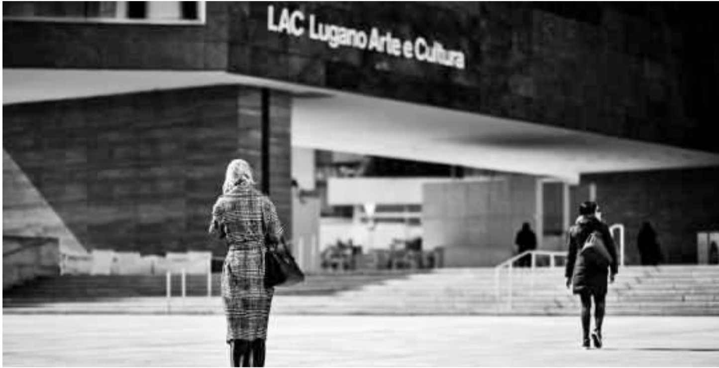
Noch bis Mitte Juni läuft im Museo d'arte della Svizzera italiana (MASI) die Ausstellung "Surrealismo Svizzera". Wer Werke von Hans Arp, Paul Klee, Alberto Giacometti, Meret Oppenheim und anderen nicht auf eigene Faust entdecken möchte, kann an einer kostenlosen Führung teilnehmen (Museumseintritt CHF 20.-/14.-). Diese finden jeweils sonntags um 11.00 Uhr statt. Eine Anmeldung online unter www.masilugano.ch ist bis zum Vortag unbedingt erforderlich.