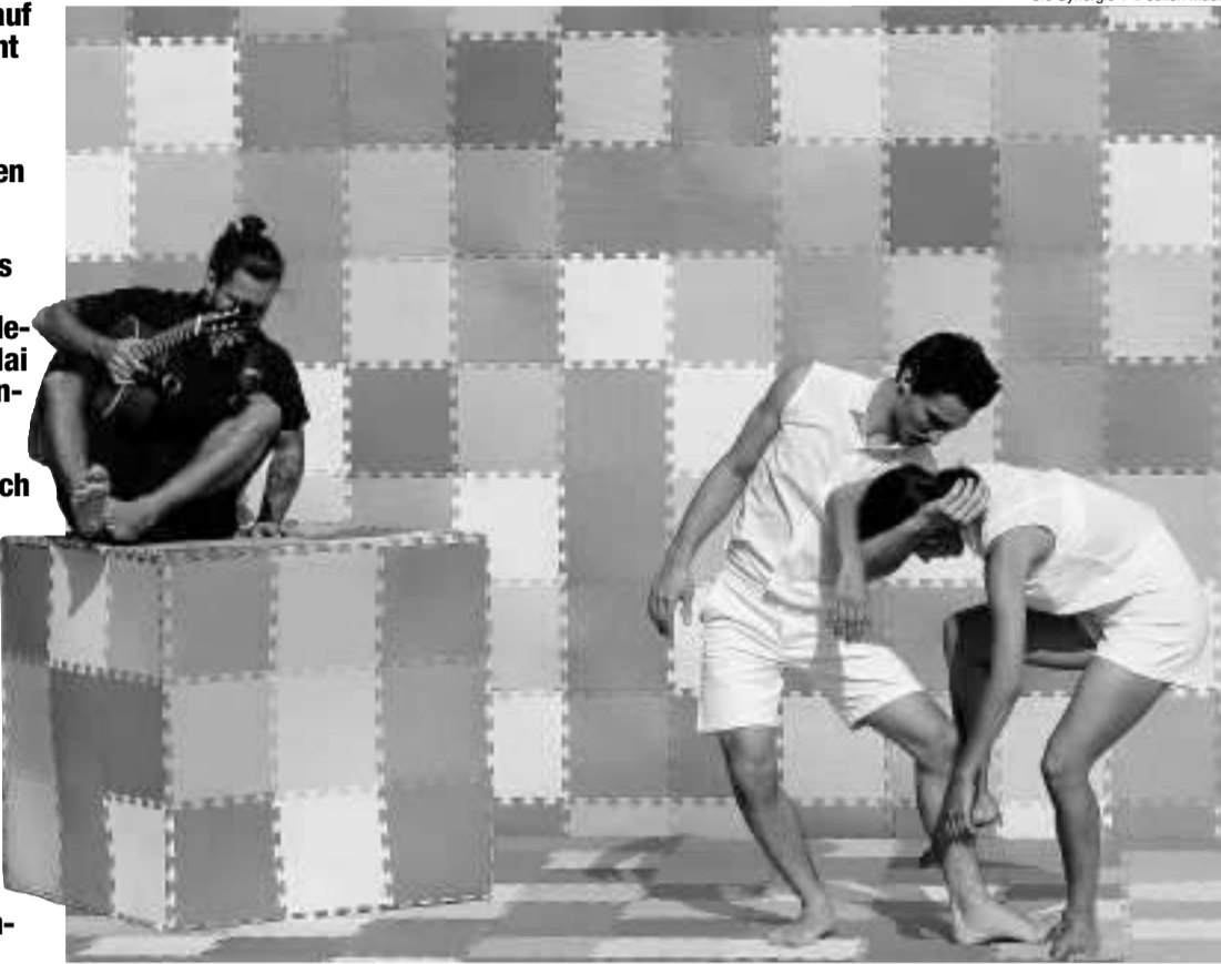
Cie Synergie 1

Früher wurde vom 30. April auf den 1. Mai die Walpurgisnacht gefeiert, ein Brauch, der vom "Tanz in den Mai" abgelöst worden ist. In der Schweiz wird allerdings nicht nur einen Abend lang getanzt, sondern jedes Jahr ein mehrtägiges Tanzfest gefeiert. Auch dieses Jahr erobern Volkstänze, Rock'n'Roll, Hip-Hop und andere Tänze vom 2. bis zum 5. Mai landesweit Theater, Kulturzentren und den öffentlichen Raum. Zum Teil sogar schon früher. Am 29. April ist nämlich Welttanztag. So bietet beispielsweise das Museo Vela in Ligornetto als Vorpremiere zum schweizweiten Tanzfest am Montag ein reichhaltiges und vielseitiges Programm, darunter eine 3D-Fotoausstellung im Park und um 19.00 Uhr die Performance "116th Dream" der Cie Synergie. Mehr Infos siehe auch unter www.museo-vela.ch , auf der Seite "Kino" (S. 30) und nächste Woche in der TZ.