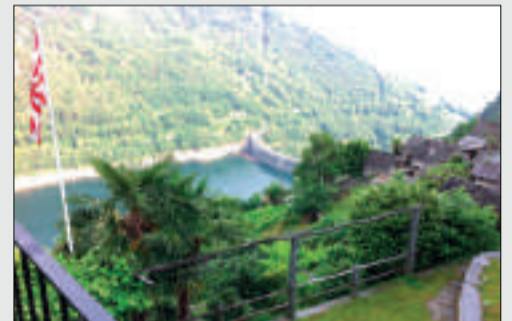
Top-Rustico mit Seesicht und Weinberg Mergoscia Wohnfläche: ca. 90 m 2 Grundstücksfläche: ca. 2'838 m 2 Kaufpreis: CHF 590'000.-- Objekt ID: W-02FAK0