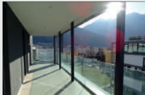
4.5 Zi.-Penthouse mit Dachterrasse und Whirlpool Bellinzona Wohnfläche: ca. 134 m 2 Terrassenfläche: ca. 28 m 2 Kaufpreis: CHF 900'000.-- Objekt ID: W-02F5MW