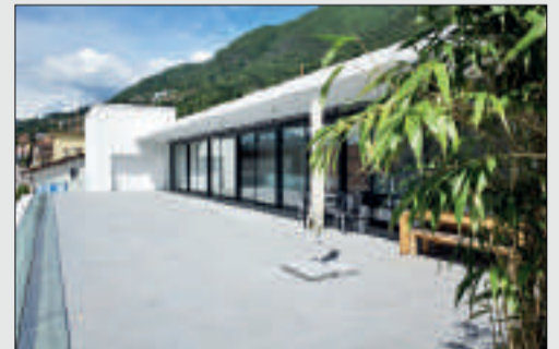
Moderne Gewerbefläche mit fantastischer Terrasse Minusio Gewerbefläche: ca. 153 m 2 Terrassenfläche: 240 m 2 Monatliche Miete inkl. NK: CHF 5'000.-- Objekt ID: G-02FUMZ

Büro Ascona · Piazza G. Motta 57 · 6612 Ascona Tel. +41 91 785 14 80 · Ascona@engelvoelkers.com · www.engelvoelkers.ch/ascona