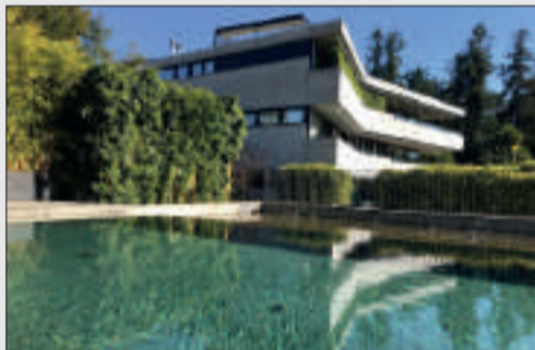
Exklusive 4.5 Zi.-Wohnung nahe Piazza und See Ascona Wohnfläche: ca. 268 m 2 Terrassenfläche: ca. 82 m 2 Kaufpreis: CHF 2'900'000.-- Objekt ID: W-02DYPW