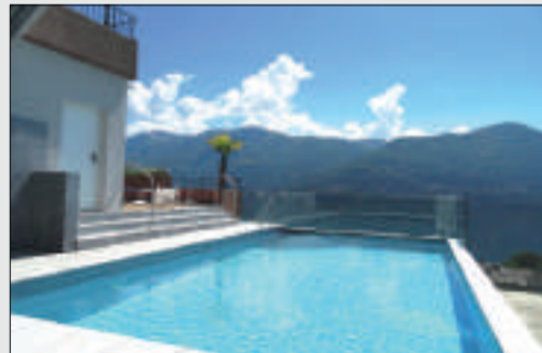
Grosszügige 5.5 Zi.-Attika mit 180° Seesicht Brissago Wohnfläche: ca. 170 m 2 Terrassenfläche: ca. 30 m 2 Kaufpreis: CHF 1'130'000.-- Objekt ID: W-02CLYQ