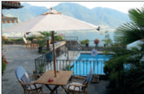
Mediterrane Ferien-Villa mit Aussenpool Brione s. Minusio Wohnfläche: 190 m 2 Grundstücksfläche: ca. 442 m 2 Kaufpreis: CHF 2'000'000.-- Objekt ID: W-02CFVF