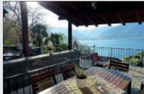
Tessiner Bijoux mit Pool und Top Seesicht Magadino Wohnfläche: ca. 62 m 2 Grundstücksfläche: ca. 566 m 2 Kaufpreis: CHF 690'000.-- Objekt ID: W-02C7CQ